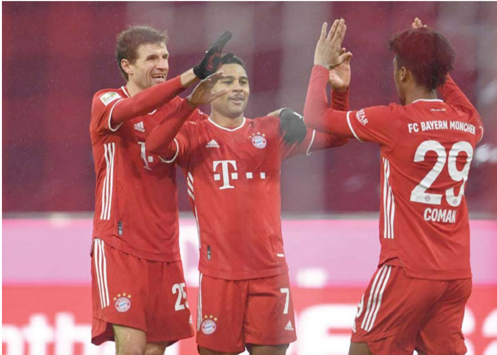
دائما في القمة

البايرن في طريق مفتوح للفوز بالبوندسليغا