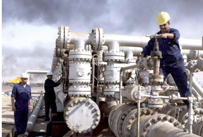
النفط محور تحولات الاقتصاد

ويعتمد العراق على النفط في تمويل نحو 98 في المئة من موازنة الإنفاق السنوية، وبسبب هبوط أسعار النفط عالمياً، خسرت البلاد نحو ثلثي عائداتها الشهرية، ولم تتوقف ماسي العراق عند هذا الحد، إذ أسهم اتفاق "أوبك+" في تعميقها بعد أن ألزمه بالخلي عن نحو ربع صادراته لمواجهة تخمة المعروض في الأسواق.