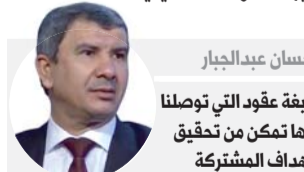
إحسان عبد الجبار صيفة عقود توتال إليها تمكن من تحقيق الأهداف المشتركة

وقام وزير النفط العراقي، الثلاثاء، صباح الرئيس التنفيذي لشركة توتال الفرنسية والوفد المرافق له بجولة شملت عدداً من الحقول والمواقع النفطية والغازية في محافظة البصرة جنوبي العراق.