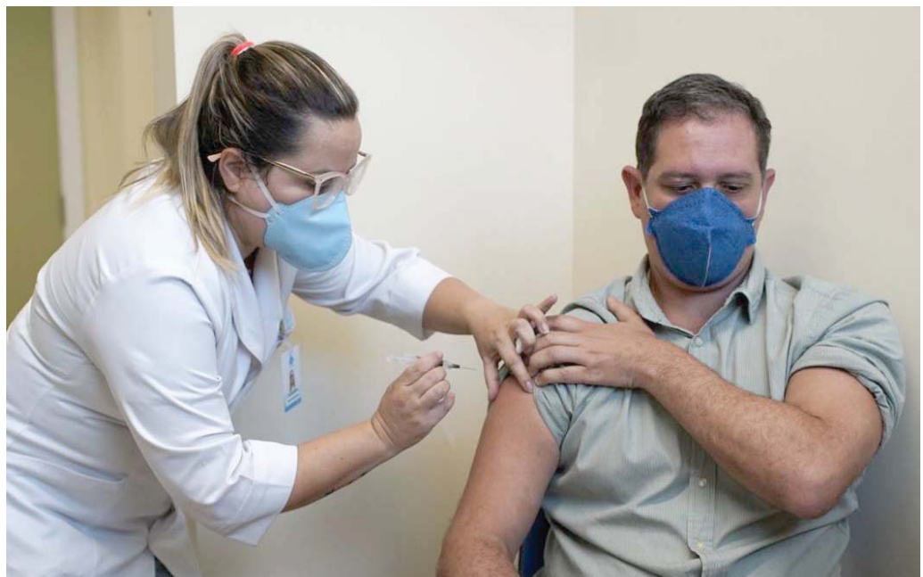
اللقاح يثير جدلا حقوقيا

وتأتي المتطلبات الجديدة الخاصة بضرورة توفر وثائق الإقامة في فلوريدا بغرض الحصول على اللقاح، بعد أن علنت العديد من الصحف الإخبارية ومن بينها "ميامي هيرالد" بوجود حالات يطلق عليها "سياحة اللقاحات"، وهي لأشخاص يسافرون إلى فلوريدا من دول أو من ولايات أخرى بغرض الحصول على