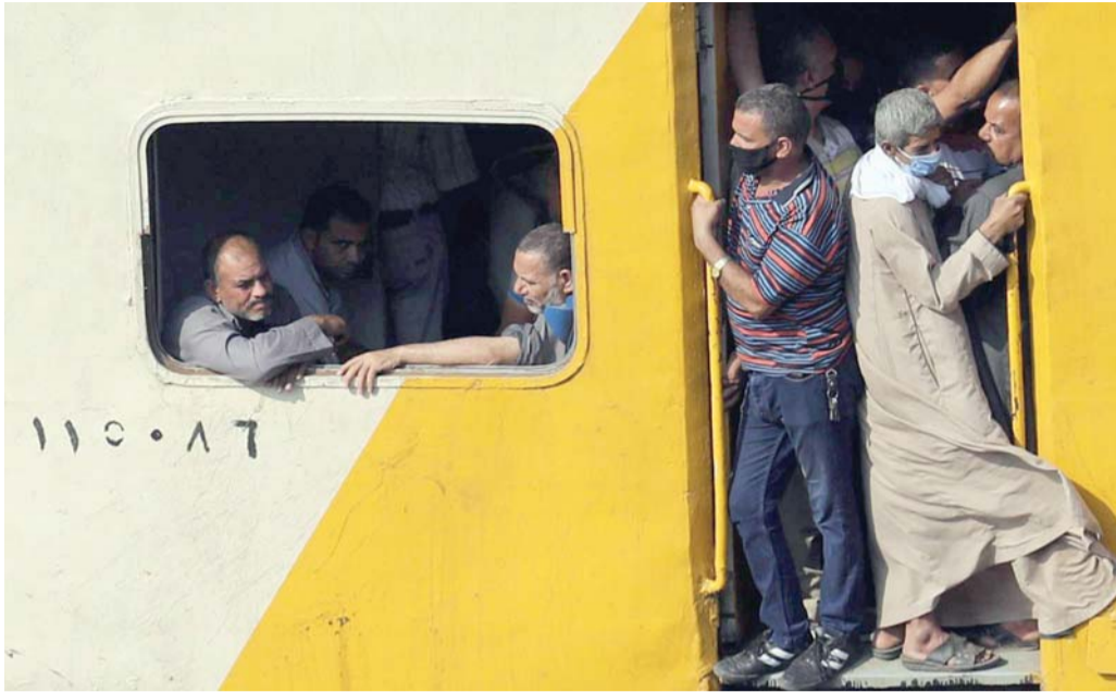
#القطار المكهرب لكل المصريين