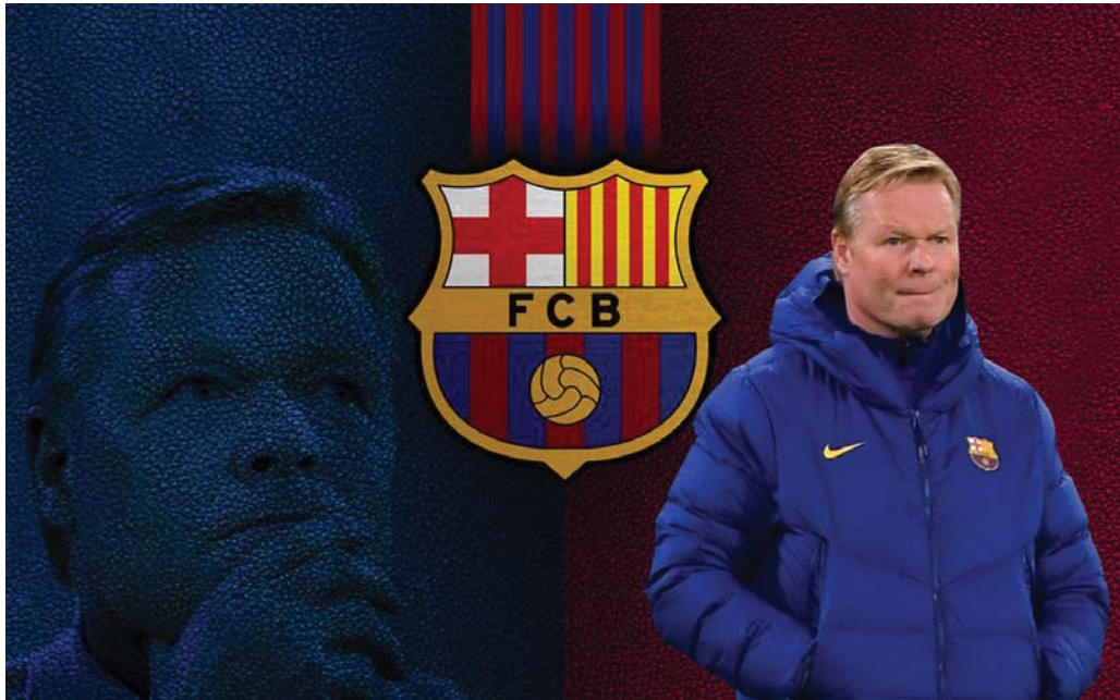
مهمة صعبة لكن ليست مستحيلة

استفاقة ميسي طوق نجاة البارسا في السوبر الإسباني