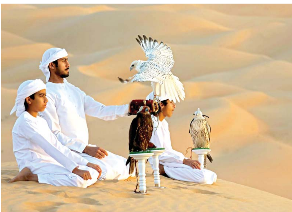
إماراتي يذب الصقور في صحراء ليوا على بعد حوالي 250 كيلومترا غرب أبوظبي

وتختلف تسميات الاحتفالات برأس السنة الأمازيغية بين "ينابر" و"امالين"، أو "اقوران"، بحسب اختلاف اللهجات الأمازيغية في الجزائر، كما تختلف طقوس الاحتفال من منطقة إلى أخرى.