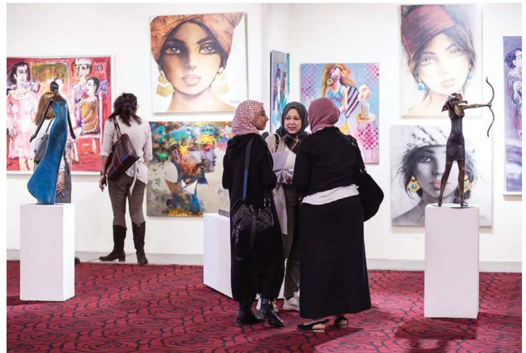
حوار فني ثري

ويعد "إيجيب آرت فير" الحدث الأول من نوعه الذي يجمع مجموعة واسعة من الفنانين العرب والمهتمين