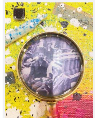
فن مارون أسمر يعتمد على توليف بصري لأشياء محطمة أو غير صالحة للاستخدام

لا يزال حادث تفجير المرفأ في شهر أغسطس الفائت يلقي بظله الوحشي على النفوس ويستمر في تصريف سمومه، كما في حلقات التطهير النفسية، في مساحات العرض الفني، ولاسيما تلك الأماكن التي أعيد ترميمها بعد الانفجار، وتلك التي نشطت على هامش "اللوزة" المزلزلة التي أصابت الصالات المتخصصة بالعرض التشكيلي.