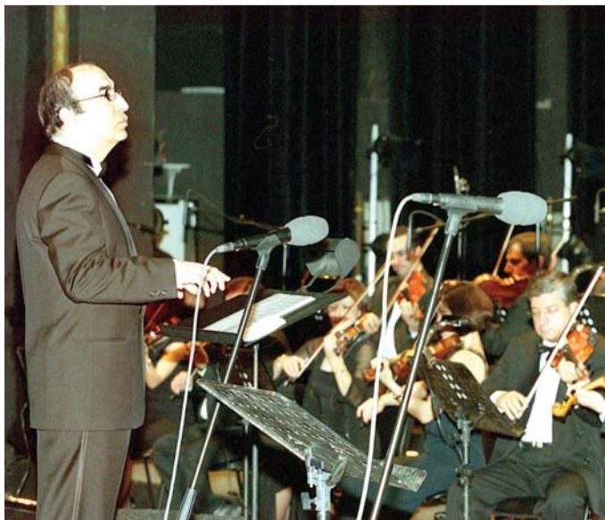
خسارة للموسيقى اللبنانية والعربية

وتابع "مئات الأغنيات اللبنانية والفرنسية والإنجليزية، وفنانين كبار صاروا نجوماً بأعمالك. ويوم اللي تسكروا الإذاعات بسبب قانون الإعلام بالتسعيرات وتشرذنا، كنت أكثر فنان تضامن معنا، وقدمت لنا تشييد حرية الإعلام. بتبقي بالقلب وبالبال والأصالة رح تضل تحكي عنك... موسيقار لبنان إلياس الرحباني".