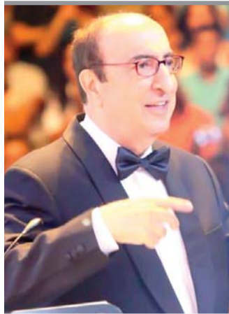
الرحباني قَدَم على مدى أكثر من ستين عاماً ألحاناً لأغان رومانسية وشعبية وساخرة ولإعلانات شهيرة

وحصل الرحباني خلال مسيرته الفنية على جوائز كثيرة من بينها جائزة مسابقة شهابية في الموسيقى الكلاسيكية في العام 1964، وجائزة عن مقطوعة "الحرب قد انتهت" في مهرجان أثينا عام 1970، وشهادة السيمفا في المهرجان الدولي للفيلم الإعلاني بالبنديقية عام 1977، والجائزة الثانية في مهرجان لندن الدولي للإعلان عام 1995، والجائزة الأولى في روستوك بألمانيا عن أغنية "سوري"، وجوائز أخرى في البرازيل واليونان وبلغاريا. وعام 2000 كزمتها جامعتا بارينغتون في واشنطن وأستورياس في إسبانيا بنيل الدكتوراه الفخرية.