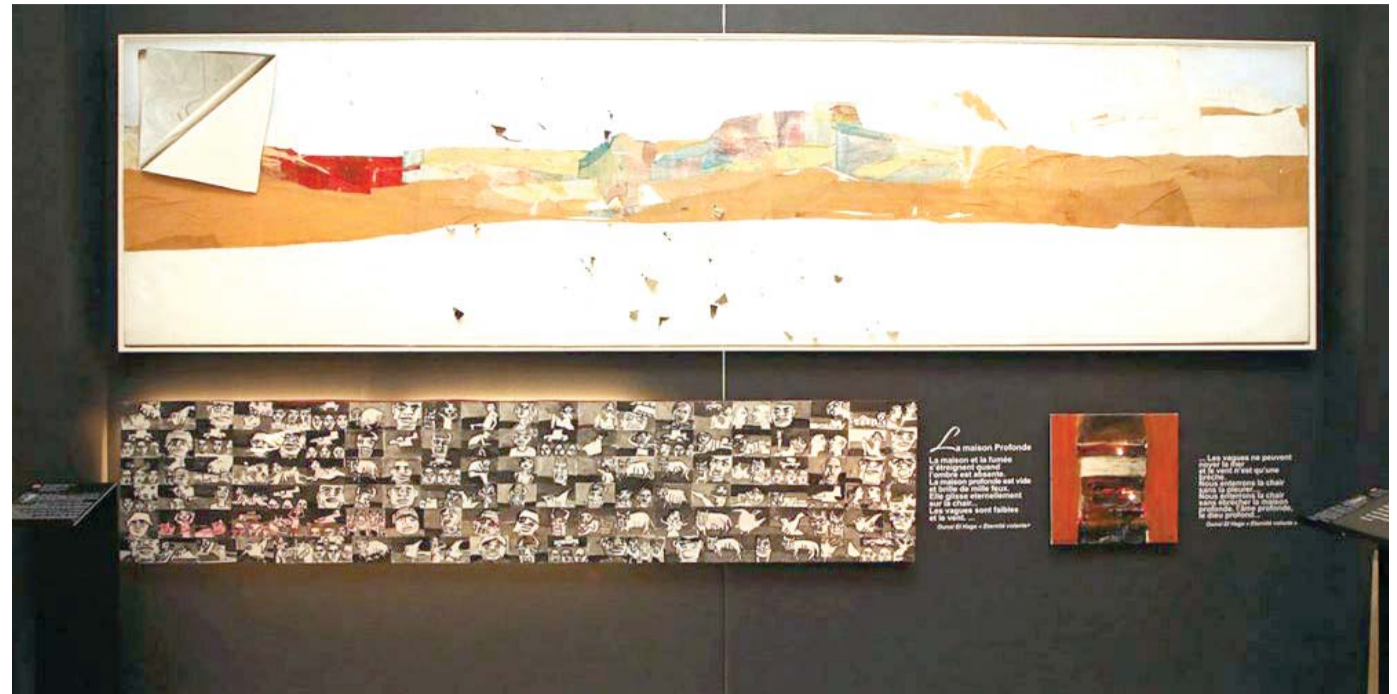
كارثة لا تنسى

وشارك أيضاً في برامج اكتشاف المواهب الموسيقية حيث كان من أعضاء شرف الموسمين العاشر والحادى عشر من برنامج ستار أكاديمي (للتعليق على الأداء)؛ وقد كان سابقاً من أعضاء لجنة تحكيم برنامج سوبر ستار.