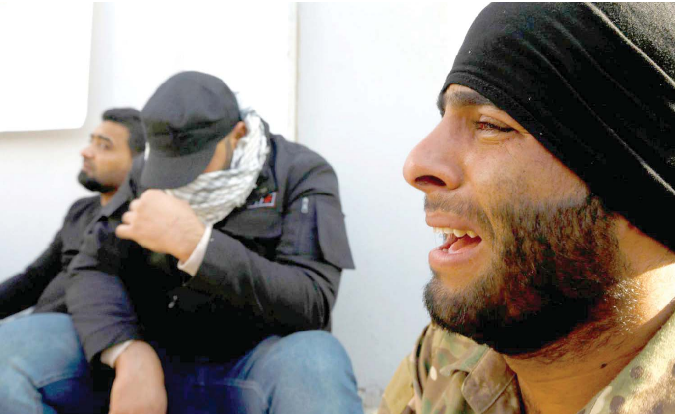
البكاء تعبيرا عن المظلومية بدلا عن الانتقام المزلزل