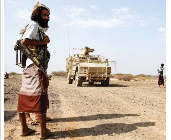
قدرات يتعين على الشرعية حسن توظيفها

ذروته بانفجارات سُمعت بالقرب من ميناء الحديدة مساء السبت". وأضافت أن هذه الحادثة "تأتي خلال فترة تزايدت فيها العمليات الجوية وسقوط الضحايا المدنيين وازدياد خروقات وقف إطلاق النار في المحافظة". وأكدت البعثة أنها "تراقب الوضع عن كثب وتنخرط في استجابة متعددة الأطراف لمنع أي تصعيد إضافي للعنف في الحديدة".