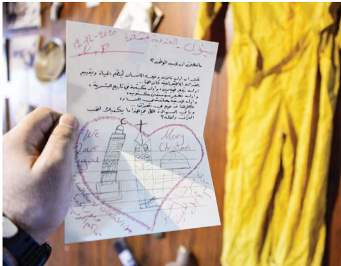
امتزج الدين بالسياسي

أخيراً.. ماذا بعد هذا النفق المظلم؟ نحن اليوم في حاجة ماسة، أشد من أي وقت مضى، إلى فك هذا الاشتباك الذي فرضته أيديولوجيات الإسلام السياسي بين الدين والسياسة. وهذا ما أخاله الطريق الصحيح لتزوية الدين وإخراجه من ملاعب الدنيا، ليعود إلى نقائه الأول كرسالة إلهية جاءت للعدل والإنصاف والمحبة والتسامح والسلام، ويؤدي وظائفه الروحية والاجتماعية والإنسانية، بعيداً عن عالم السياسة وشروطه، ولتسقط بذلك صفة العصمة عن كل من يريد العمل في السياسة، فيعود مثله كممثل بقية الناس، يصيب ويخطئ، ولا يدعي أنه مفوض باسم الدين.