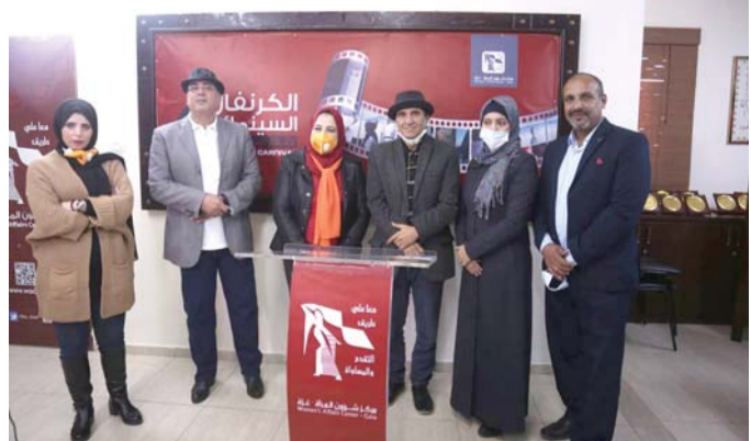
كرنفال سينمائي للمناهضة للعنف

وتم عرض الكرنفال عبر تقنية الإنترنت بفعل التدابير الوقائية لمكافحة