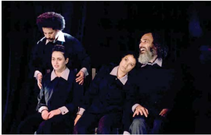
الممثلون لا يعالجون المشكلة فقط بل يقترحونها