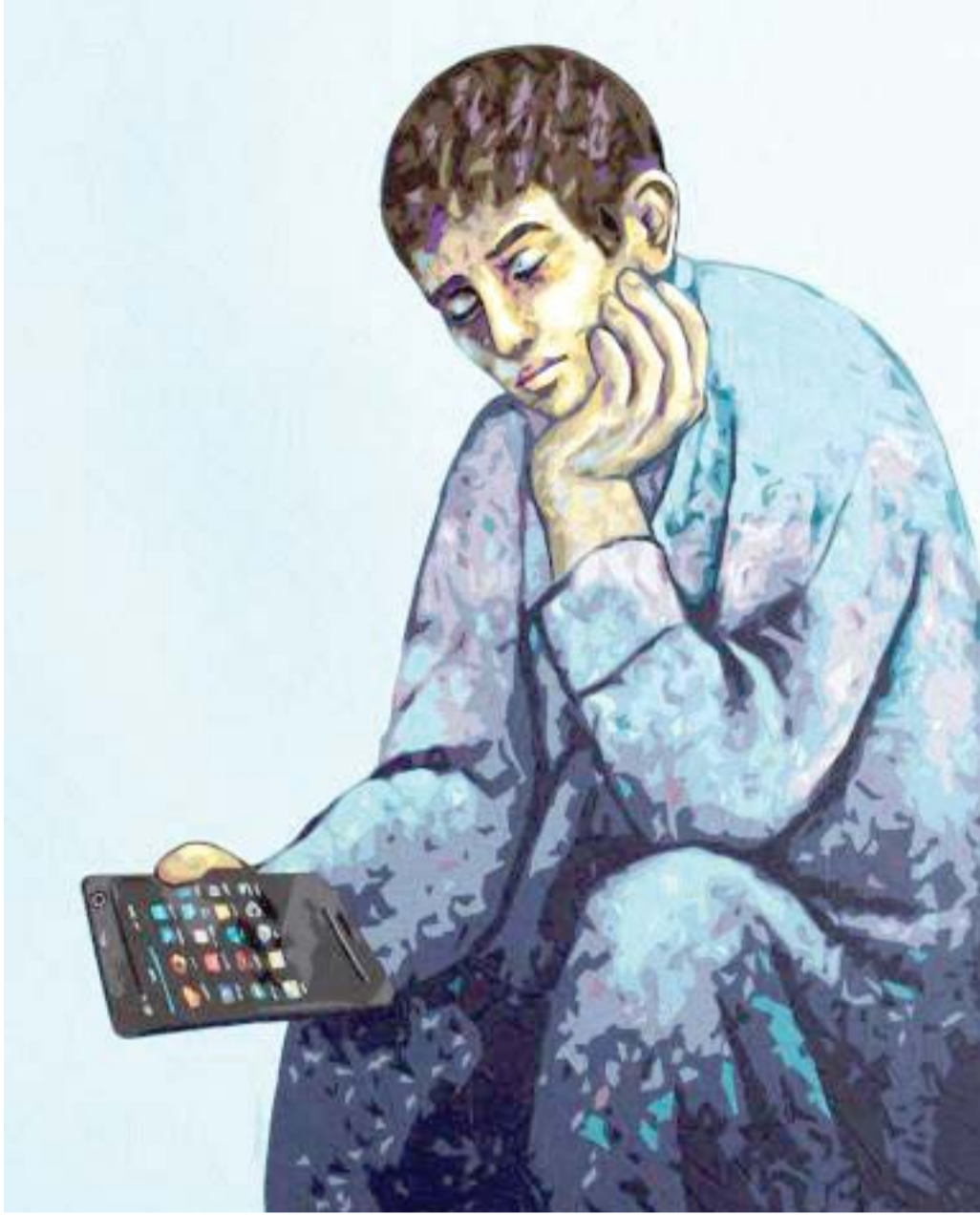
سهولة التواصل أدت إلى عزلة الأفراد (لوحة للفنان إلياس إيزولي)