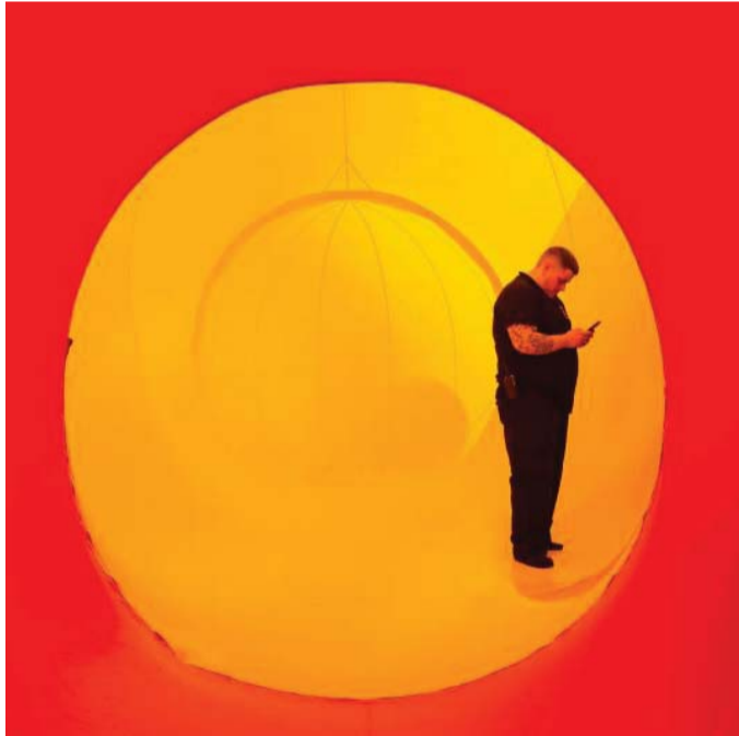
العالم الافتراضي مجال للوهم والعقد النفسية

نفسها التي انطلقت منها، فغازي يتعرف على أخيه في موقف اليم، يمضي إلى المستشفى بعد حادث تعرض له، وهناك تعود به الذاكرة إلى محنته مع أمه، وكيف أن أخاه استحوذ على ثروة والده، وأن كليهما لا يتحلمان مغبة أفعال والدهما التائه الذي كان له من كنيته نصيب كبير، وينقل ذلك التيه إلى أولاده من بعده.