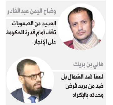
هاني بن بريك

القى المجلس الانتقالي بثقله للمشاركة في مفاوضات الحل النهائي لازمة عبر ممثلين في فريق المفاوضات التابع للشرعية، والذي يقودها المجلس أنه سيكون بوابته لتبني قضايا كالاتحاد وحق تقرير المصير واستعادة دولة الجنوب، كما ترد وسائله الإعلامية.