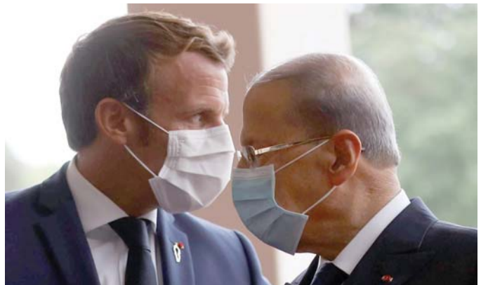
الكل عالق في غياب الضوء الأخضر الأميركي

وللمزق تداعيات خطيرة على جميع الأطراف، فبدون دعم الولايات المتحدة، لن تتمكن المنظمات الدولية والجهات المانحة