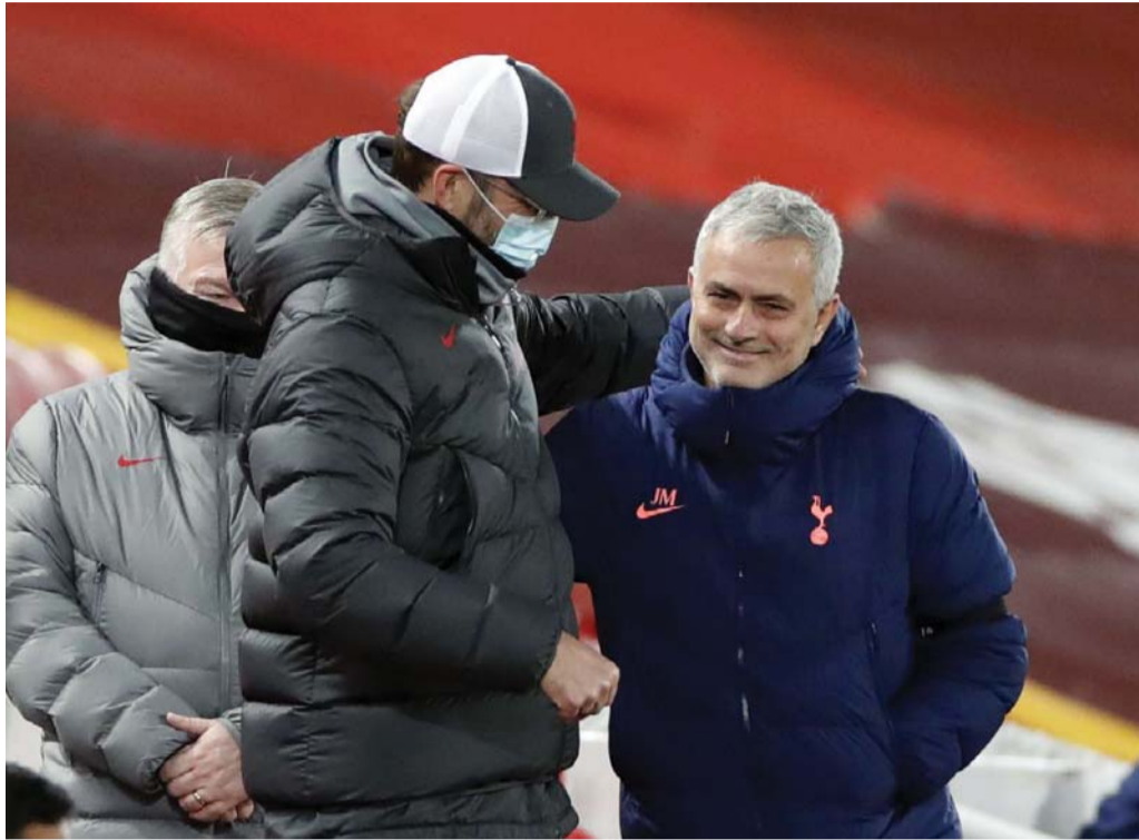
شكرا على مجهودك

مورينيو ينتقد كلوب وغوارديولا بسخرية لاذعة