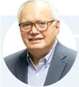
محمد العربي مصر والإمارات لن تواجه لودهدما التمدد التركي شرق المتوسط

وأضاف، العربي في تصريح لـ "العرب"، أن انضمام أبوظبي للمنتدى رسالة مهمة بأن هناك تحسناً قوياً سيواجه أي محاولة للتطاول على حقوق الآخرين في منطقة شرق المتوسط، خاصة في المناطق البحرية داخل الحدود القبرصية واليونانية، مع وجود رغبة من الدول المؤسسة للمنتدى لتكون دوراً فعالة لحماية جميع مصالح دوله.