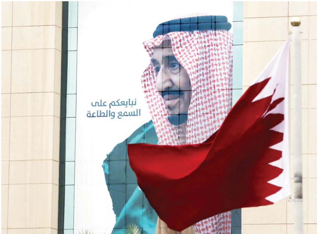
نبايعكم على السمع والطاعة

ملف المصالحة بيد الملك سلمان والسعودية تطالب بترتيبات ملموسة