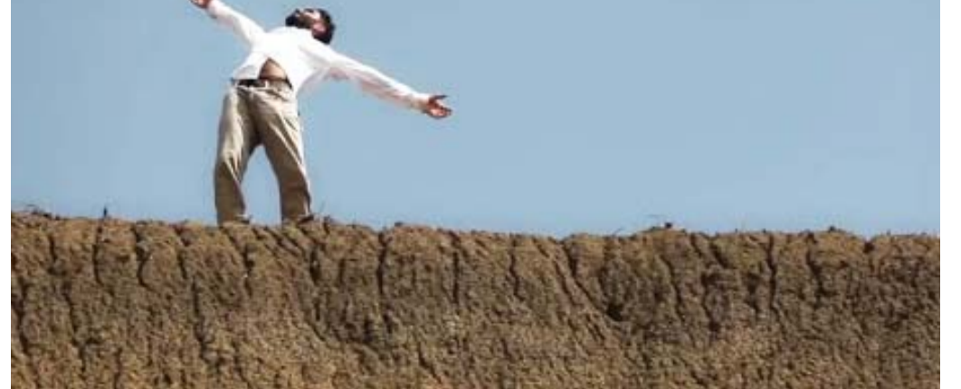
أفلام بين المتعة والرسالة المادفة (فيلم المدسطنسي)

وكانت أيام قرطاج السينمائية من أولى التظاهرات الثقافية والفنية التي