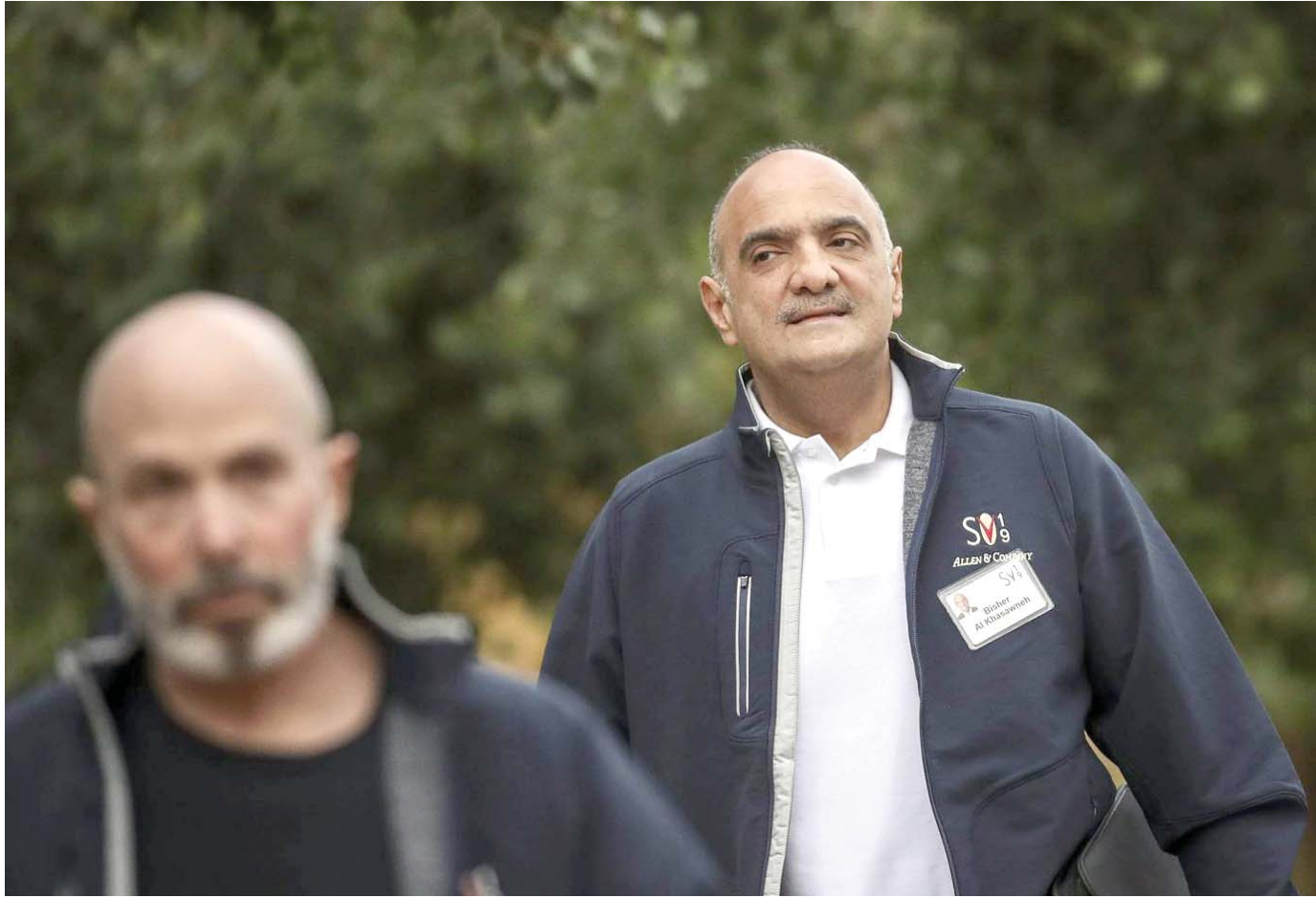
هل يسعى الخصاونة لكسر شوكة النقابات

المحامون الأردنيون يضربون.. والمعلمون يستنفرون في ظل توجه لحل نقابتهم