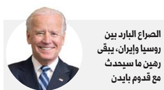
الصراع البارز بين روسيا وإيران، يبقى رهين ما سيحدث مع قدوم بايدين

سرعوا من عمليات تجنيدهم لاسيما ضمن المنطقة الممتدة من الميادين حتى البوكمال بريف دير الزور الشرقي.