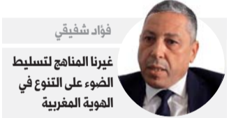
فؤاد شفيقي غزينا المناهج لتسليط الضوء على التنوع في الهوية المغربية

وبعيد ذلك، وقع وزير التربية المغربي مع جمعيتين يهوديتين مغربييتين اتفاق شراكة "لتعزيز مفاهيم التسامح والتنوع والتعايش في المؤسسات المدرسية والجامعية". وفي بادرة رمزية، وقع الاتفاق في بيت الذاكرة في الصورة وهو متحف مكرس للتعايش بين اليهود والمسلمين،