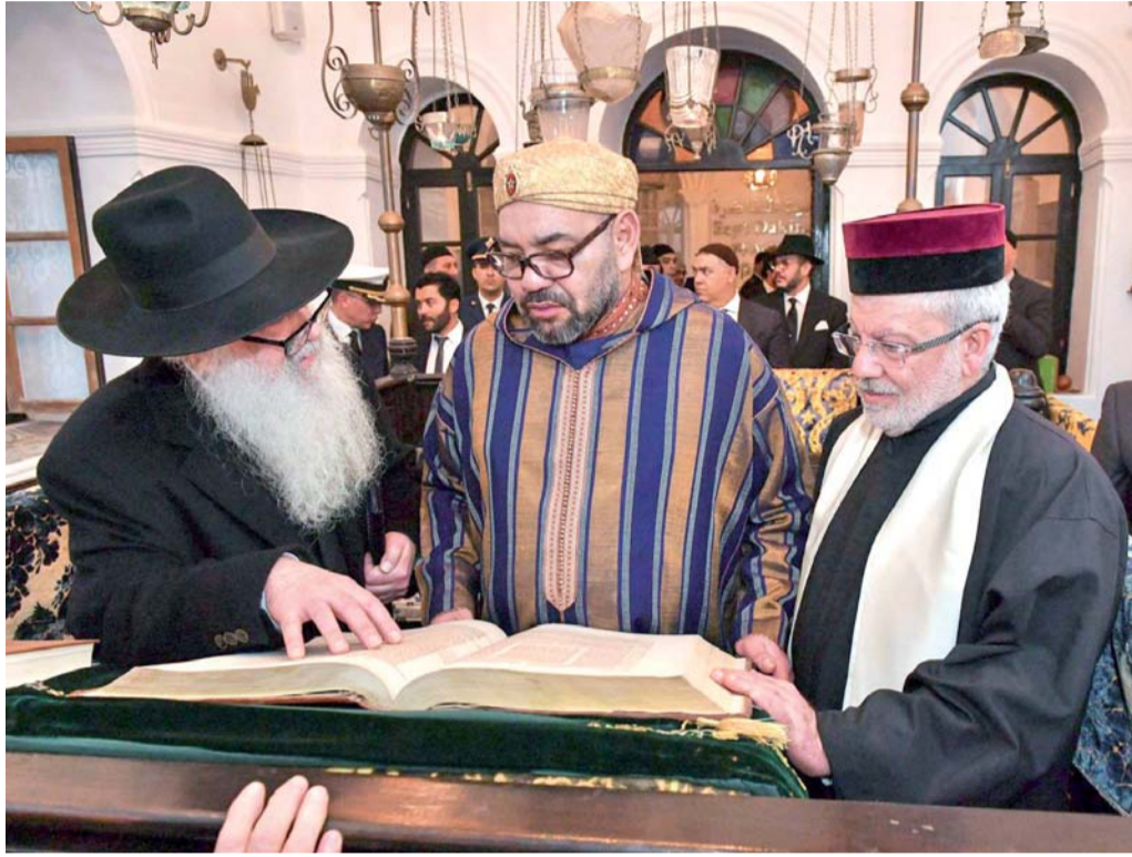
اهتمام خاص بالتراث اليهودي

وأضاف البيان "لذلك تعترف الولايات المتحدة بالسيادة المغربية على كامل أراضي الصحراء وتعيد تأكيد دعمها لإقرار المغرب الجاد والموثوق والواقعي للحكم الذاتي، باعتباره الأساس الوحيد لحل عادل ودائم للنزاع على أراضي الصحراء". ورحب العاهل المغربي الملك محمد السادس بـ"الموقف التاريخي" الذي اتخذته الولايات المتحدة في قضية الصحراء.