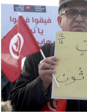
مناخ يتسم بالتوتر والانقسامات