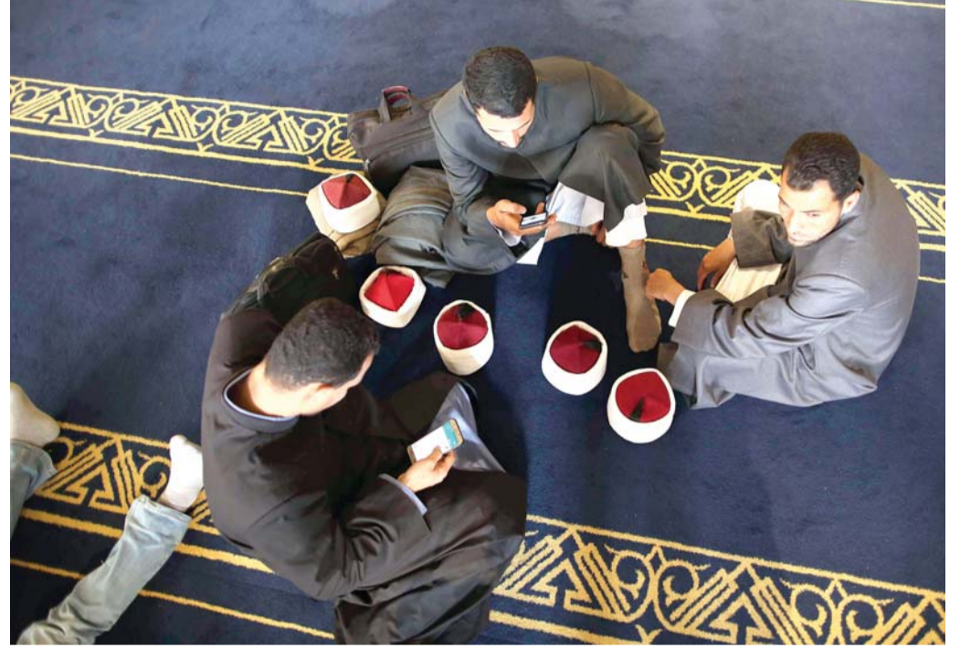
صورة وفق الضوابط الشرعية

وتابعت أنها ظهرت في أحد المسلسلات دون حجاب، لكنها بقيت مترددة بشأن إبقائه أو خلعها، مؤكدة أنها "أصبحت أكثر نضجاً ووعياً،