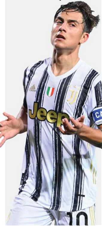
ديبالا مهدد بالابتعاد عن يوفنتوس

ديبالا شارك أساسيا في 6 مباريات من بينها 4 مباريات لعبها كاملة، بينما لعب 10 مباريات منذ انطلاق الموسم لم يسجل فيها إلا هدفا واحدا