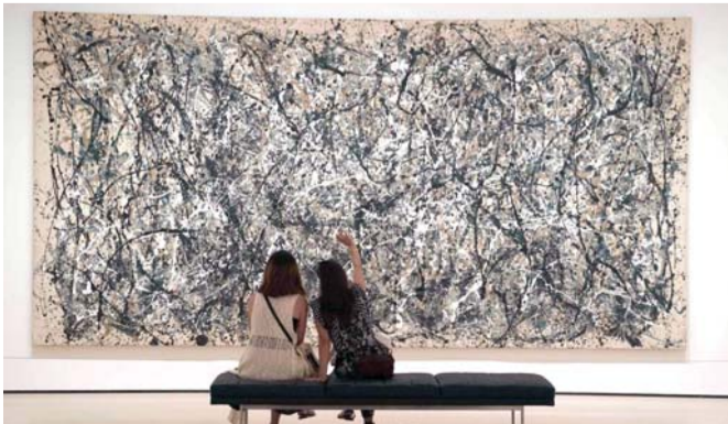
لا عفوية في لوحات جاكسون بولوك

وبالرغم مما يظنه الكثيرون من أن الوقت الذي كان بولوك يستغرقه في تنفيذ أعماله كان قصيراً، فإن تلك الأعمال كانت قليلة. وهو ما يؤكد أن اللوحة الواحدة كان يتطلب إنجازها الكثير من الوقت. بين بولوك والديك الصيني مسافة عنوانها الخبرة.