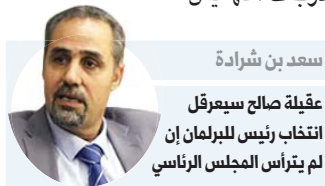
سعد بن شرادة

بنغازي (البيبا) - تتزايد حدة التكهّنات بشأن مستقبل رئيس البرلمان الليبي عقيلة صالح، بعدما بدا أنه سيكون "الخاسر الأكبر" من المسار السياسي. وتحول صالح خلال الفترة الماضية إلى "قائد للسلام" في إقليم برقة (المنطقة الشرقية) حيث تمّ تضخيم دوره مقابل تهميش القائد العام للجيش المشير خليفة حفتر. وقدم رئيس البرلمان -الذي قاد حملة ضغط على الجيش للانسحاب من طرابلس من خلال إقناع القبائل التي يشارك أبنائها في القتال بعدم جدوى الاستمرار في الحرب- مبادرة سياسية قبل انتهاء المعارك في محيط طرابلس تبنّتها القاهرة في ما بعد وتنص على وقف القتال وتشكيل سلطة تنفيذية جديدة ممثلة بمجلس رئاسي وحكومة. وتواترت خلال الفترة الماضية أنباء عن أن ما دفع صالح إلى التحرك نحو السلام هو حصوله على ضمانات بشأن تعيينه رئيسا للمجلس الرئاسي الجديد. لكن فشل الحوار الليبي في تونس، والذي كان من بين أسبابه رفض تولى صالح للمنصب مقابل تصاعد الحديث عن الإبقاء على فايز السراج على رأس المجلس الرئاسي، يؤكد أنه فعلا "الخاسر الأكبر" مما يجري من تحركات.