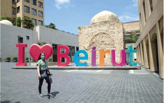
اللبنانيون إلى أين؟

والتنتشر في الشوارع مشاهد العشرات من التجار يبحثون عن رزقهم، والكثير منهم استعان بمكبرات الصوت للتدليل على وجودهم والإعلان عن خدماتهم المتعددة، إضافة لما يسوقونه من بضائع في سياراتهم أو على دراجاتهم