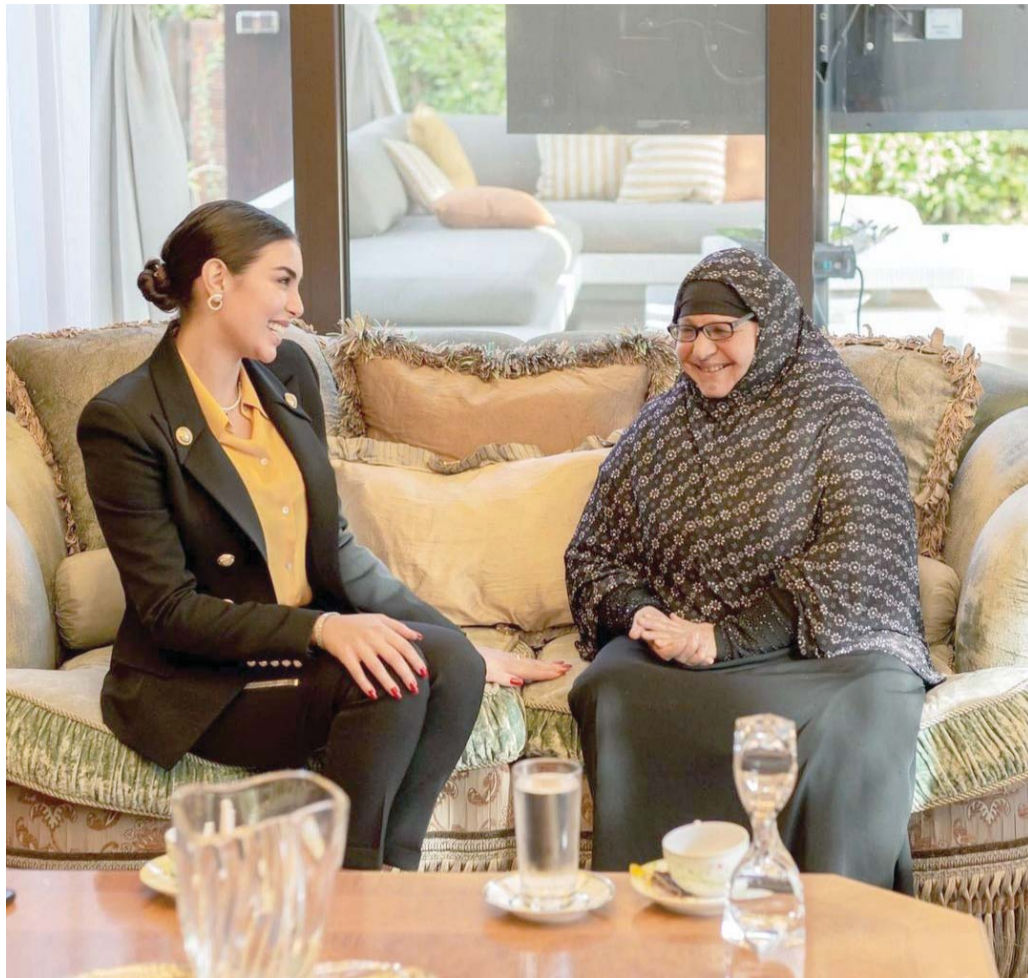
«سيدة المطر» صنعت الحدث في مصر