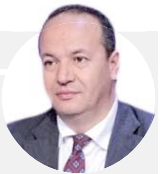
حاتم المليكي هناك تقصير من الرئيس الذي يتوجب عليه الخروج للعلن

وطيلة الأيام الماضية شهدت تونس احتجاجات متصاعدة في ولايات (محافظة) قفصة وقابس وسيدي بوزيد وباجة والقصرين وغيرها، فيما لم يسجل سعيد غير إطلالة نيتية في أعقاب لقاء جمعه برئيس الحكومة هشام المشيشي، وهو ما زاد من حدة الانتقادات الموجهة إليه خاصة أن الاحتجاجات ذهبت إلى أقصاها حيث تم غلق بعض مواقع الإنتاج. وأكد سعيد على وجوب الحرس على توفير المواد الضرورية للتوسنيين والنوسنسيات في مختلف مناطق الجمهورية، داعياً إلى تطبيق القانون على كل من يسعى إلى قطع الطرقات والحيلولة دون وصول المواد الغذائية والأساسية للمواطنين.