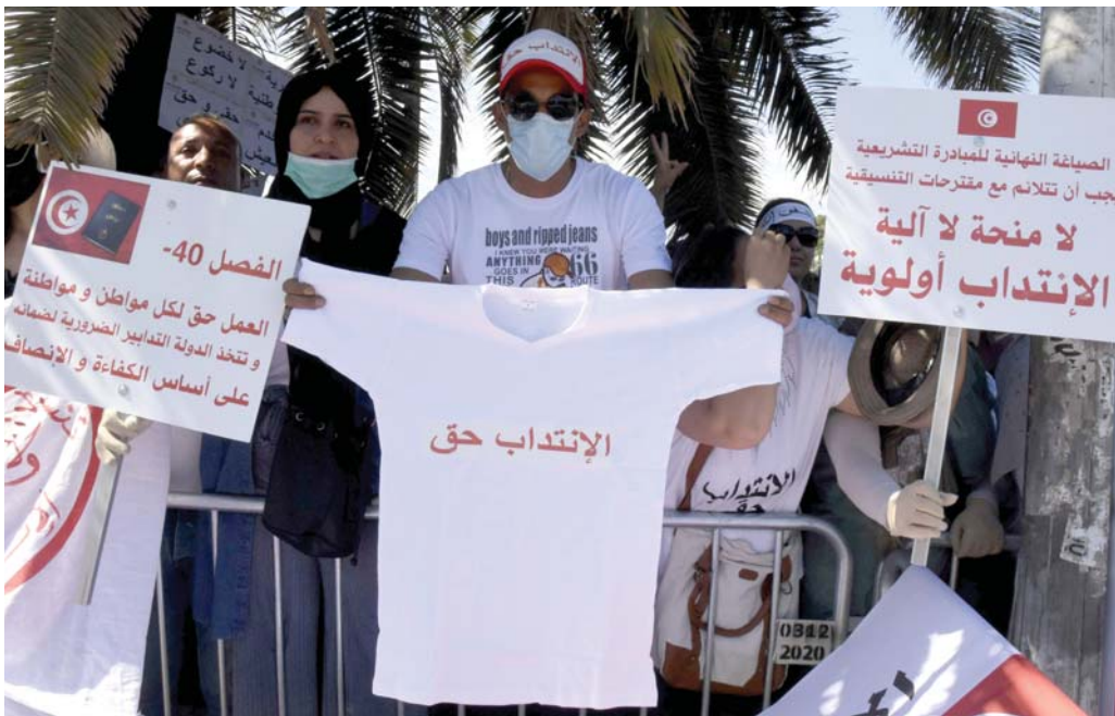
بوادر صدام بين الحكومة والشعار التونسي

دائرة الاحتجاجات تتسع وسط مخاوف من عجز المشيشي عن تطويقها