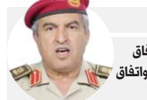
خالد المحجوب الجيش ملتزم باتفاق وقف إطلاق النار واتفاق جنيف وفخراته

وكانت الجولة الأولى من الحوار السياسي قد انتهت من دون التوصل إلى تفاهات عن أسماء بعينها لتولي المناصب السيادية في ما وصفه مراقبون بمناورات للإسلاميين الذين سعوا إلى تمرير مقترح ينص على الإبقاء على بعض الوجوه الموجودة حالياً في المشهد ما وتر جلسات الحوار.