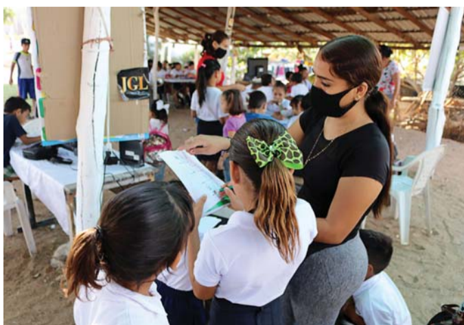
الأطفال في حاجة إلى بعض القواعد لمعرفة كيفية التصرف

برلين - يتفق علماء الاجتماع على أن الأطفال يحتاجون إلى عدد قليل من القواعد لمساعدتهم على النظام ومعرفة كيفية التصرف. وقد تكون بعض القواعد عامة تتعلق بالنظافة والأخلاق، بينما يكون البعض الآخر خاصاً بما تريده كل أسرة. وعموماً تساعد القواعد على تجنب الفوضى داخل المنزل والعيش في طمأنينة. وكثيراً ما يقارن الأطفال كيفية التصرف. وقد تكون بعض القواعد عامة تتعلق بالنظافة والأخلاق، بينما يكون البعض الآخر خاصاً بما تريده كل أسرة. وعموماً تساعد القواعد على تجنب الفوضى داخل المنزل والعيش في طمأنينة. وكثيراً ما يقارن الأطفال أنفسهم بأصدقائهم، فيقولون إنه يتم السماح لهم بقضاء وقت أطول على الإنترنت، أو يمكنهم التمتع بالعباب الفيديو أو يمكنهم النوم في وقت متأخر أو يحصلون على مصروف أكثر، أو أن أباهم يشترطون لهم ملابس أفضل. أحياناً يكون من الصعب التفاعل مع مقارنات من قبيل "ولكن الأطفال الآخرين يسمح لهم بفعل هذا"، إذن، كيف يجب أن يكون رد فعل الآباء؟ تقول الخبيرة التربوية نيكولا شمسيت، إنه من المهم رسم حدود، كقول شيء مثل "نعم يمكنني تخيل أن الأطفال الآخرين يُسمح لهم بفعل هذا، ولكن كل أسرة لها قواعدها الخاصة ونحن مختلفون".