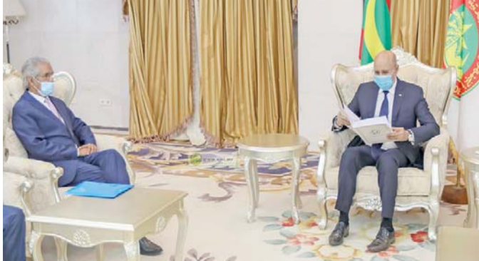
البوليساريو تحاول استمالة موريتانيا

وشرع المغرب في تعبيد الطريق الذي يربط معبر الكركرات مع الجانب الموريتاني من الحدود، وذلك بتنسيق تام مع المسؤولين الموريتانيين لتسهيل عملية عبور الشاحنات وتسهيل حركة التجارة.