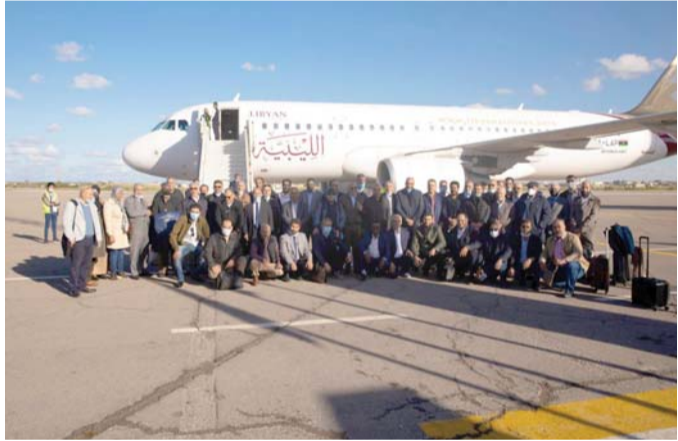
أجواء من التناغم

وأوضحت أن "البعثة تواصلت مع القائم بأعمال النائب العام الليبي (المستشار إبراهيم مسعود) لمعالجة هذه المسألة"، وطمأن أعضاء الملتقى أنه "بمجرد توفر أية معلومات تتعلق بمزاعم الرشاوى، ستكون أول من يطع عليها".