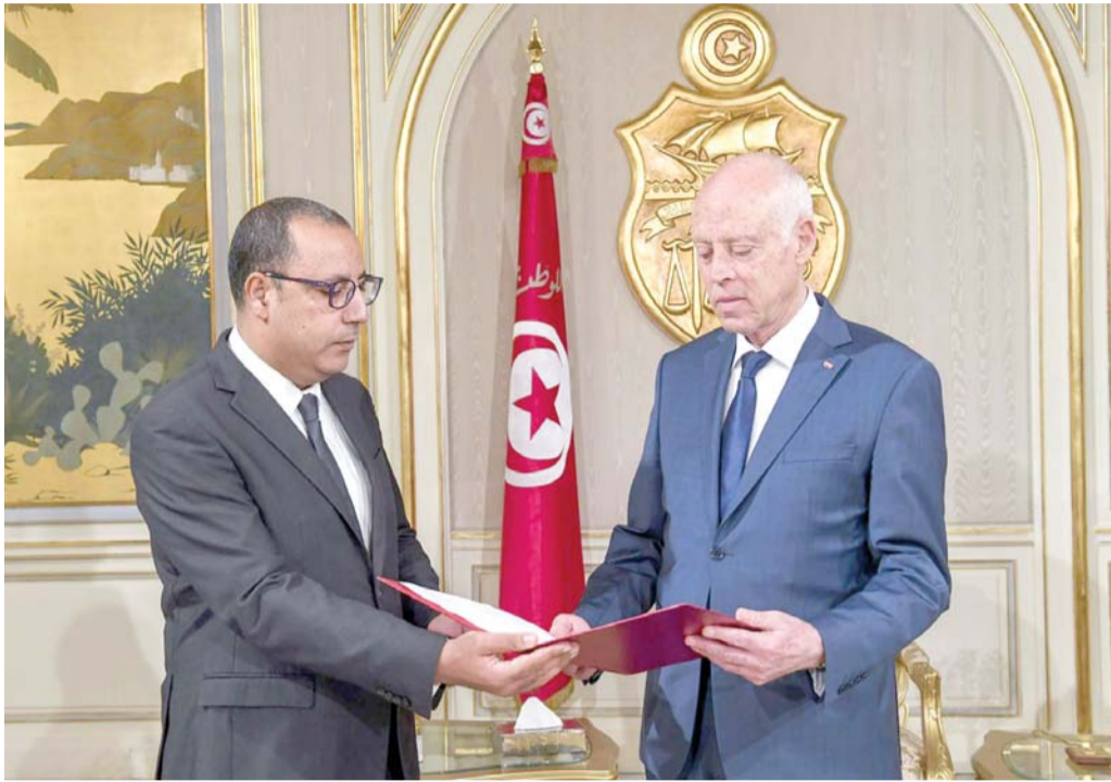
حكومة المشيشي محور الجدل السياسي

النهضة تُداري أزمته الداخلية بدعم مقترح تشكيل حكومة وحدة وطنية