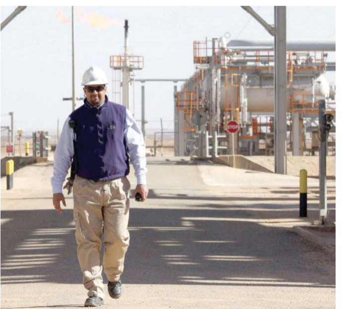
غاز في مرمي النيران