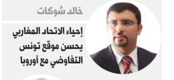
خالد شوكات إحياء الاتحاد المغربي يحسن موقع تونس التفاوضي مع أوروبا

تونس - تواجه الشراكة التونسية - الأوروبية انتقادات كبيرة داخل الأوساط الاقتصادية، حيث يعتبر خبراء أن السياسة الأوروبية غير المتكافئة قادت إلى الركود، في ظل تسجيل أرقام خطيرة على مستوى فقدان الوظائف وهجرة الأدمغة وارتفاع نسب البطالة والفقراء، ما وضع الشراكة الأوروبية على محك عدم الجدوى الاقتصادية والاجتماعية. ووجهت منظمة أوكسفام الدولية انتقادات حادة إلى دول الاتحاد الأوروبي بسبب سياساتها التجارية غير العادلة وغير المتكافئة في دول شمال أفريقيا وتونس والمغرب، ما قاد في النهاية إلى ركود في التنمية الاقتصادية.