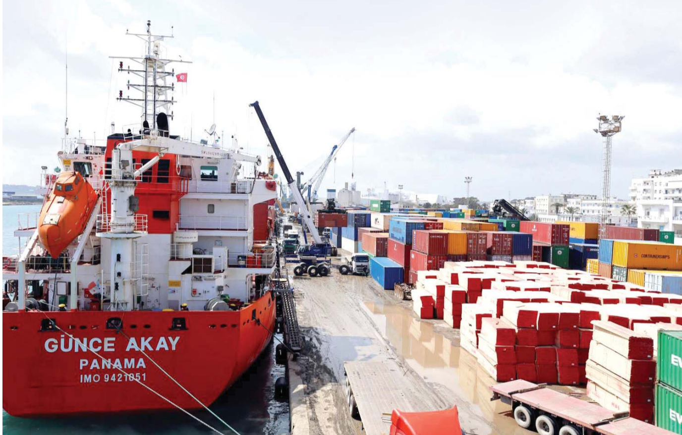
ما جدوى شراكة بلا عوائد ولا فرص عمل؟

سياسات أوروبا غير المتكافئة في أفريقيا قادت إلى ركود التنمية الاقتصادية