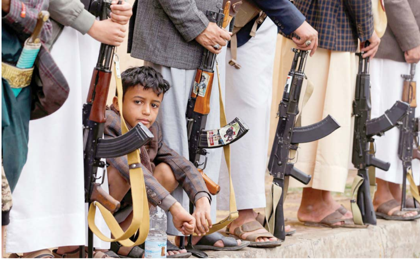
تحالفات سرالية متناقضة لكسب المعركة

تاريخ الخلافات بين الأحزاب والقوى والمكونات اليمنية يؤكد عدم الوثوق في مشهد تعمه الفوضى