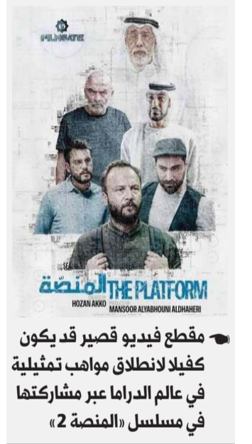
مقطع فيديو قصير قد يكون كفيلا لانطلاق مواهب تمثيلية في عالم الدراما عبر مشاركتها في مسلسل «المنصة 2»

وبطبيعة الحال، انتهت شركة «فيلم جيت» الإماراتية للإنتاج الفني، في الثاني عشر من نوفمبر الجاري من استئصال مقاطع الفيديو التمثيلية المشاركة في مسابقتها الجديدة التي حملت عنوان «تحدي التمثيل» عبر حسابها الرسمي على تطبيق «تيك توك»، وذلك بهدف اكتشاف مواهب جديدة في عالم التمثيل من جميع أنحاء الوطن العربي. وسيتمكن الفائزون ممن شاركوا في التحدي الخاص عبر «تيك توك» من الحصول على فرصة للمشاركة في دور تمثيلي في الموسم الثاني من مسلسل «المنصة 2»، الذي عرض الموسم الأول منه منذ فترة عبر نتفليكس محققا نجاحا، وانتشارا محليا وعربيا وعالميا.