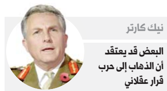
نيك كارتر البعض قد يعتقد أن الذهاب إلى حرب قرار عقلاني

● وأضاف "إذا نسيت أحوال الحروب فإن الخطر الكبير من وجهة نظري هو أن البعض قد يعتقد أن الذهاب إلى الحرب قرار عقلاني". وتابع "علينا أن نتذكر أن التاريخ قد لا يعيد نفسه لكنه له إيقاع، وإذا عدنا إلى القرن الماضي قبل الحربين العالميتين، فاعتقد من دون شك أنه كان هناك تصعيد رئيس أركان الدفاع في بريطانيا إن أي تصاعد للتوترات الإقليمية أو أخطاء في تقدير الأمور قد يؤديان في نهاية المطاف إلى صراع واسع النطاق". وأضاف كارتر "اعتقد أننا نعيش في زمن أصبح العالم فيه مكاناً يسوده الغموض والقلق بشدة. كما أن ديناميكية المنافسة العالمية سمة من سمات زماننا بالطبع وأرى أن الخطر الحقيقي الذي نواجهه هو أن نشهد تصعيداً يؤدي إلى سوء تقدير في ضوء وجود الكثير من الصراعات الإقليمية في الوقت الحالي". ورداً على سؤال عما إذا كان هناك تهديد حقيقي بشبوح حرب عالمية أخرى، أكد رئيس أركان الدفاع في بريطانيا "أقول إنها من المخاطر وعلينا أن نكون واعين بهذه المخاطر". وقال كارتر، الذي أصبح قائداً للجيش البريطاني عام 2018، "إن من المهم تذكر من ماتوا في الحروب السابقة على سبيل التحذير لمن قد يكررون أخطاء الماضي".