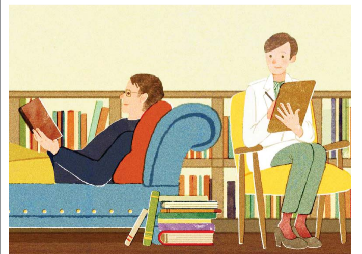
القراءة علاج نفسي

وترى أن السبيل إلى ذلك يكون عبر تخصيص حيز مهم وواضح في الزمن الدراسي خاص بالقراءة، والتخفيف من انتظاظ المقررات المدرسية، وتزويد المدارس العمومية بمكتبات وتخصيص وقت لولوجها وتوفير أجواء تعين على القراءة فيها، إلى جانب توفير مكتبات في البيوت.