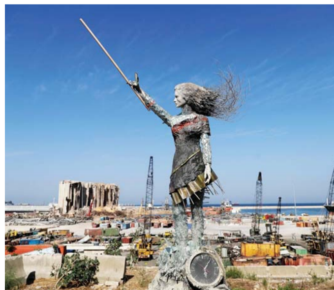
هروب من بيروت المدمرة

قبل وقوع الانفجار، كان لبنانيون كثير يقرعون ابواب الهجرة جراء الانهيار الاقتصادي المتسارع، وهربا من طبقة سياسية يتهمونها بالفساد وهدر المال العام، ويطالبون منذ 17 أكتوبر برحيلها مجتمعة. وجاء الانفجار ليفاقم غضبهم. وييدي لبنانيون يومياً على وسائل التواصل الاجتماعي وشاشات التلفزيون، رغبتهم بالهجرة والبحث عن فرص عمل في الخارج.