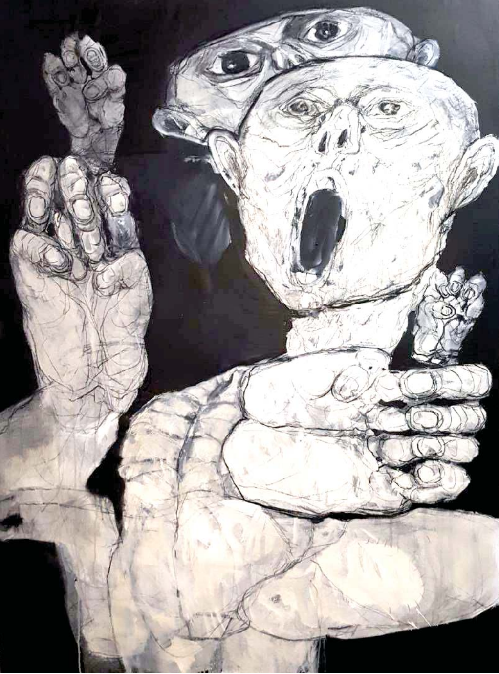
لأجل الابن كل شيء جاتز (لوحة للفنان عمران يونس)

يشير الروائي إلى الخيارات القاسية التي يجد بطله نفسه محاصراً بها، كأن يصبح مجرماً وقاتلاً ويقضي على شخص بريء من أجل استعادة ابنه، أو أن يصله ابنه جثة هامدة، وهنا يكون الصراع الشرس الذي يدمر