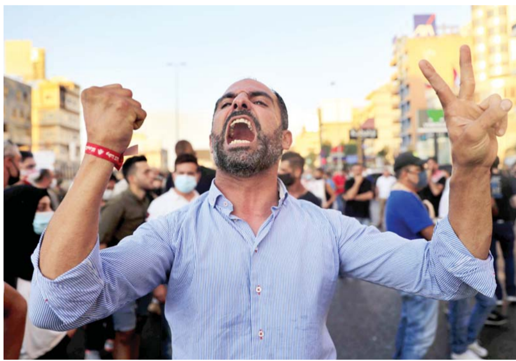
الشارع اللبناني يتعدو الأحزاب

حزب الله وحركة أمل أقاما متاريس ويصعب عليهما التراجع عنها