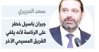
سعد الحريري جبران باسيل خطر على الرئاسة لأنه يلقي الفرق المسيحي الآخر

وقال "كل فريق سياسي يستطيع أن يخترع مشكلة في تشكيل الحكومة، ولكن إذا كانت الأحزاب السياسية تريد فعلا وقف الانهيار وإعادة إعمار بيروت، عليها أن تسير بالمبادرة الفرنسية".