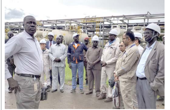
قطاع واعد يقطن الاستثمارات

القاهرة - وافق بنك الاستثمار الأوروبي، على توفير نحو 750 مليون يورو لبنك مصر، من أجل إعادة إقراضها للشركات الصغيرة والمتوسطة، حسبما أعلنت وزيرة التعاون الدولي المصرية رانيا المشاط الاثنين. وشددت المشاط في بيان، على أهمية الشراكة مع بنك الاستثمار الأوروبي في دعم جهود التنمية في مصر على المستوى الحكومي