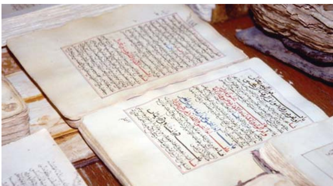
المخطوطات كنوز معرفية

وعلى اختلاف عدد هذه المخطوطات، وتنوع مجالات اختصاصاتها، نجد بعضها مهماً في طي النسيان، ولم يحقق منها إلا القليل، وبعضها أُعيد تحقيقه وطبع مرات عدة، إما لأهميته، أو لسهولة رواجه بين الناس، أو لتوفر دواعي علمية تتطلب إعادة تحقيقه من جديد. ويرى المؤلف في كتابه، الصادر عن دار النشر الجامعي الجديد بتمسان، بأن تحقيق المخطوطات وإخراجها بشكل سليم، أصبح من الأهمية بمكان اليوم، لأنه يصل حاضر الأمة بماضيها، ويساهم في بعث كنوزها الدفينة من العلوم والآداب والفنون فيستفيد طلبة العلم، والمتقنون عامة، مما خلفه الآباء