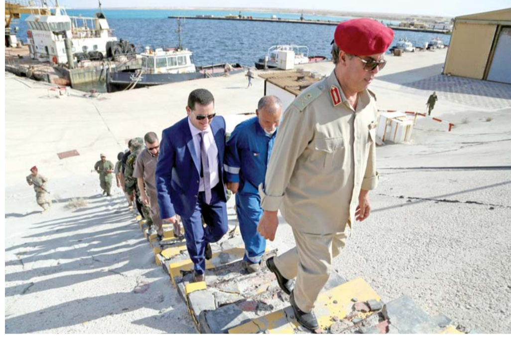
صعود شاق إلى الاتفاق

محادثات في المغرب وجنيف ومصر وسط مساع فرنسية لاستضافة مؤتمر دول جوار ليبيا