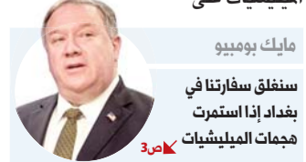
مايك بومبيو سنفلق سفارتنا في بغداد إذا استمرت هجمات الميليشيات

ولا يعول الكاظمي على دور إيراني إيجابي في العراق، لاحتواء خطر الميليشيات على