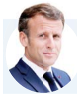
الرئيس الفرنسي بوبخ عون والحريري ويصف حزب الله بالميليشيا غير المسؤولة

وقال الراعي "أصبحت البلاد أمام أخطار متعددة" دون حكومة في موقع القيادة.