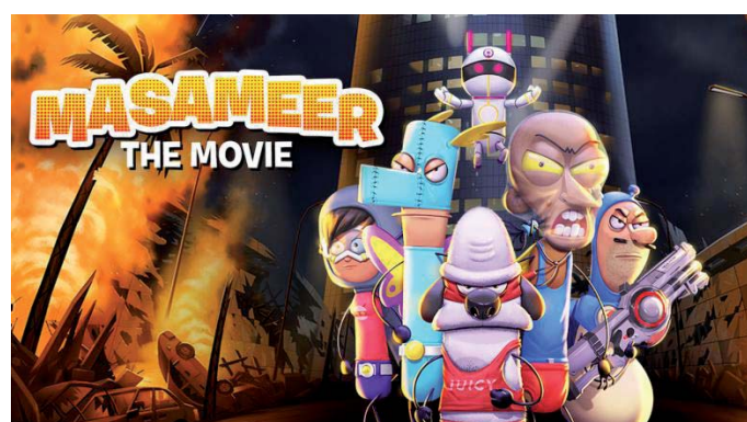
أول فيلم «أنيميشن» سعودي

السعودية والبرامج السعودية، بدءا بـ«شبابيك الصحراء»، ومرورا بمسلسل «وساوس»، وأخيرا فيلم «المسافة صفر» الذي عرض في عيد الأضحى الماضي. ويعد برنامج «مسامير» الذي يناقش عددا من القضايا الاجتماعية، أشهر البرامج الكرتونية السعودية خلال السنوات الماضية، وهو من إخراج مالك نجر. ومنذ بدايته في العام 2011، نُشر أكثر من 60 حلقة من البرنامج عبر القناة الخاصة به، والتي بلغ عدد مشتركيها أكثر من مليونين ونصف المليون مشترك. وفيلم «مسامير» امتداد لنجاحات المسلسل الذي عرض على يوتيوب على مدار ست سنوات بالعنوان ذاته، ولاقي