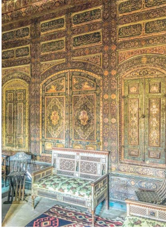
الغرفة الدمشقية بجامع جابر أندرسون بجوار أحمد بن طولون