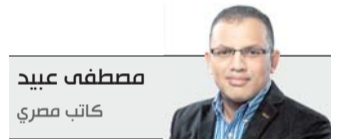
مصطفى عبيد كاتب مصري

وأشار إلى أنه يصوّر الآثار باعتبارها كائنات حية تنبّه الأسرار والحكايات المختلفة،