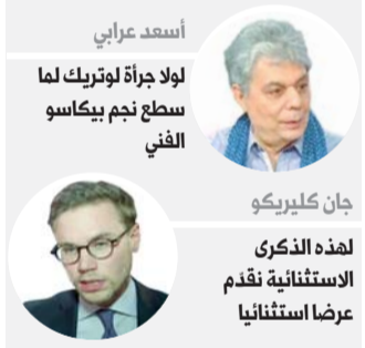
أسعد عرابي لولا جراءة لوتريك لما سطع نجم بيكاسو الفني

استمرت مسيرة لوتريك الفنية بالكاد 15 عاما، بينما امتدت مسيرة بيكاسو لأكثر من سبعة عقود. كلاهما كانا فنانين لامعين منذ الطفولة، وكلاهما جذبتهما باريس خلال شبابهما، وكلاهما رفض التعليم الأكاديمية المفروضة عليهما. ولكن قبل كل شيء، كان إتيانها للرسم أحد العوامل الرئيسية التي أعطت معنى لعمل كلا الفنانين.