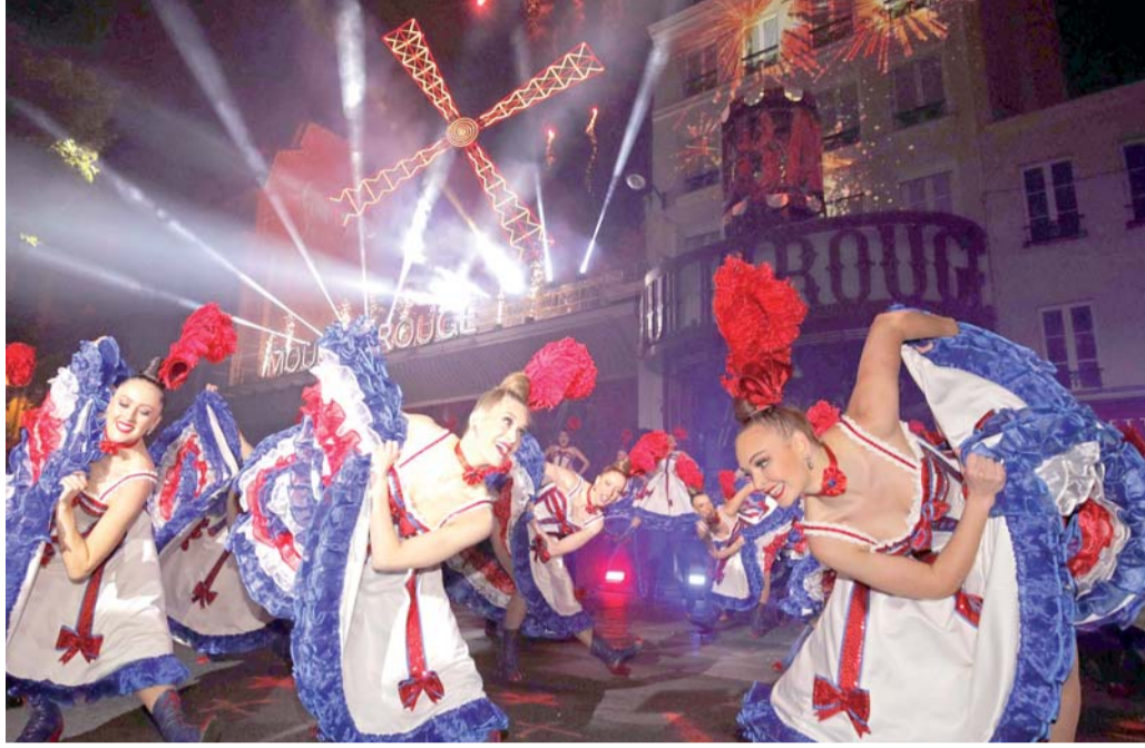
احتفالات الذكرى 130 لافتتاح ملهى مولان روج