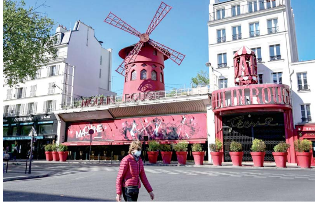
مولان روج.. توقف القلب إلى حين