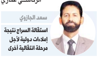
سعد الجازوي استقالة السراج نتيجة إملاءات دولية لأجل مرحلة انتقالية أخرى