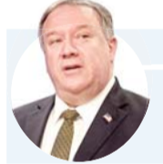
مايك بومبيو حزب الله يهدد اللبنانيين ويستغل اقتصادهم

وأوضح البيان "ينحو بعض من يشكل الحكومة في الظل إلى مصادرة قرار المكونات الأخرى بعد منع الرئيس المكلف (مصطفى أديب) من التشاور مع الكتل واستحداث آلية جديدة تقضي بمنع المكونات من تسمية وزراءهم والإخلال بالتوازن عبر انتزاع حقيبة المالية منها". والأربعاء، أعربت الرئاسة الفرنسية عن "أسفها" لعدم احترام السياسيين اللبنانيين التعهدات التي قطعوها خلال زيارة ماكرون، لتشكيل الحكومة خلال 15 يوماً. وقال قصر الإليزيه، بحسب ما نقلته شبكة "يورو نيوز" الأوروبية (مقرها فرنسا)، "لم يفت الأوان بعد، يجب على الجميع تحمل مسؤولياتهم والعمل أخيراً لمصلحة لبنان وحده عبر السماح لرئيس الوزراء مصطفى أديب بتشكيل حكومة في مستوى خطورة الوضع".