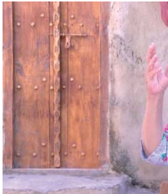
الخوض مجددا في القضايا المصرية

ومن المنتظر أن يقع تصوير الجزء الثاني من المسلسل بإحدى الدول الأوروبية بما يوافق البيئة التي تناسب الحبكة الزمنية للأحداث، إضافة إلى وجوب توفر البيئة الصحية التي تتيح لطاقم العمل التصوير في أمان في زمن كورونا.