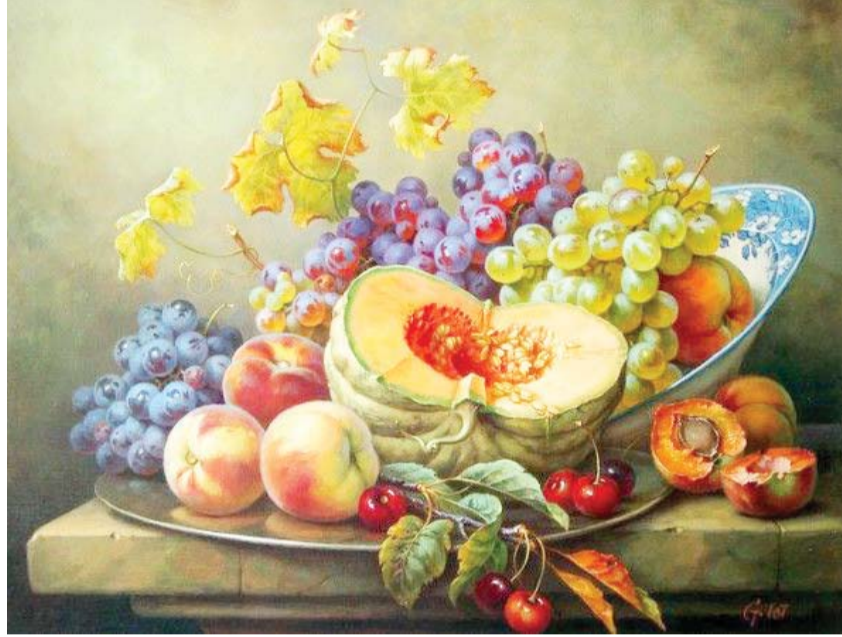
عمل معاصر يستمد مفرداته من خيرات الأرض

هل اختفت «الطبيعة الميتة» أم انبعثت في أشكال أخرى