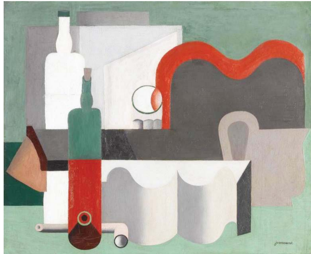
إدانة لمجتمع الاستهلاك

ابعدوا لوحات رائعة، استنصروا فيها نقل واقع محدد بدقة عجيبة، كالتقاط قطرة الندى على حبة فراولة، والضوء المنعكس على زجاج إبريق، وطراوة طريدة، وحببيات قشرة برتقالة، ورهافة بتلات وردة، والتصاع دنور بطيخة، مع الإمساك بالأجواء الصامتة التي تلفها. وكلها حسب تناول بعضهم توحى بالطابع العرضي للحياة، فيما يرى غيرهم أنها إنما تعكس متعة امتلاك سانشيز كوتان، وبيتر كلين، ويان فديز دي هيم، وفيليم كليزون هيدا، ولويان بوجان، ولويس ميلنديث، وسواهم ممن