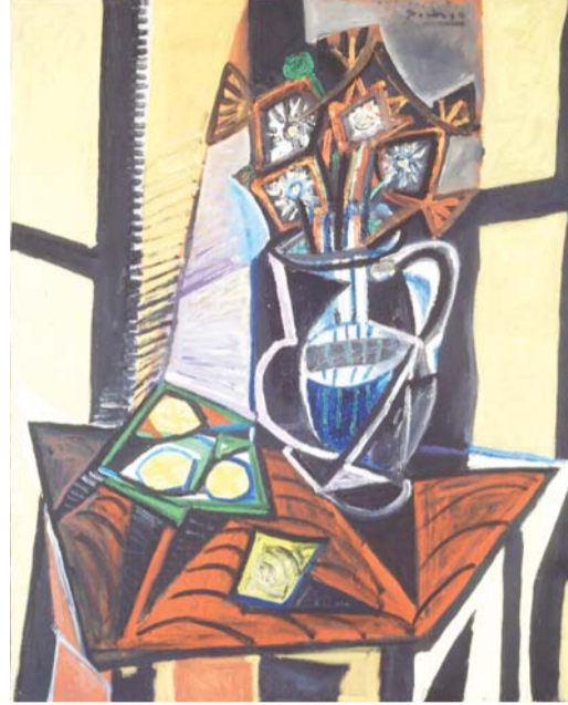
طبيعة ميتة أقرب إلى التكعيبية