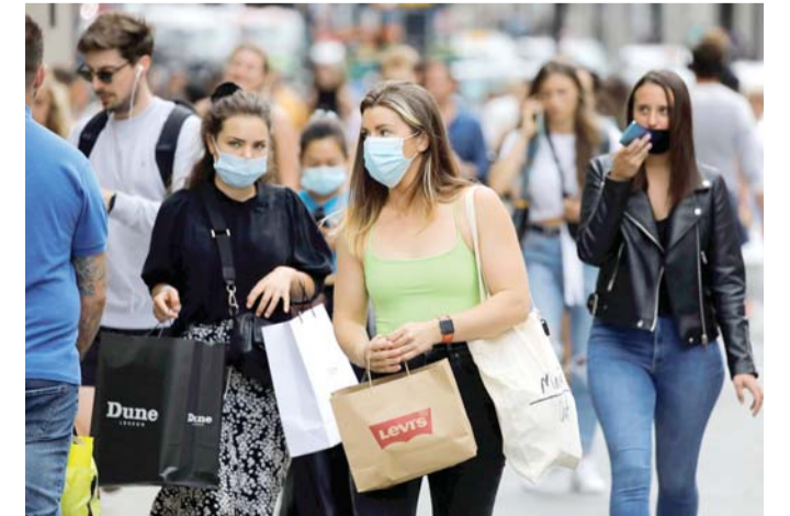
خطوات حذرة لفتح الاقتصاد

لندن - تسببت قيود الإغلاق في تخطي الدين العام البريطاني عبئة تريليوني جنيه إسترليني، في سابقة تاريخية تعكس وطأة وباء كوفيد - 19 على الاقتصاد وتدفع الحكومة إلى التحذير من "قرارات صعبة" سيتعين اتخاذها.