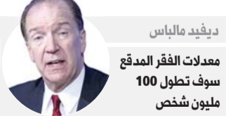
ديفيد مالبارس معدلات الفقر المدقع سوف تطول 100 مليون شخص

ونسبت وكالة رويترز إلى مايكل هيوسون المحلل لدى شركة سي.أم. سي ماركس قوله إن "هذا قد يمنح وزير المالية هامش تحرك ضئيلا هذا الخريف" حين يعلن ميزانية تنتظر بترقب كبير.