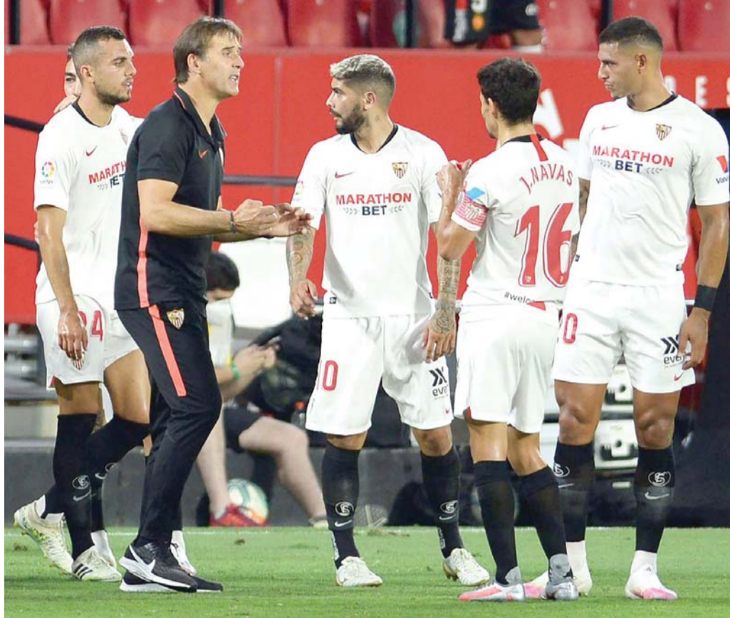
سكون في الموعد