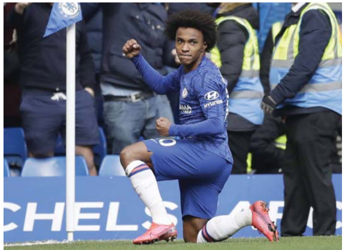
بحث عن هدف جديد

لكن وبحسب صحيفة "ميرور" البريطانية، فإن إرسال لا يريد التعجل في حسم صفقة كوتينييو (28 عاما)، لأن التعاقده مع ويليان يمثل أولوية بالنسبة للنادي في الميركاتو الصيفي الجاري. ومن المقرر أن يعود كوتينييو إلى برشلونة عقب انتهاء مشواره بايرن في دوري الأبطال، وقد يكون ذلك على يد