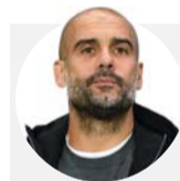
بيب غوارديولا نحن هنا من أجل محاولة الفوز بلقب دوري الأبطال

وباستثناء افتقاده لخدمات الأرجنتيني سيرجيو أغويرو بسبب الإصابة، يخوض سيتي مباراة السبت بصفوف مكتملة وفي وضع بدني ممتاز، لاسيما بعد أن ركز غوارديولا على تحضير فريقه لسدوري الأبطال منذ عودة المنافسات من التوقف الذي فرضه كوفيد - 19، عوضا عن إهدار الطاقة في الدوري الممتاز بما لا يفربول كان محققا بعيدا جدا.