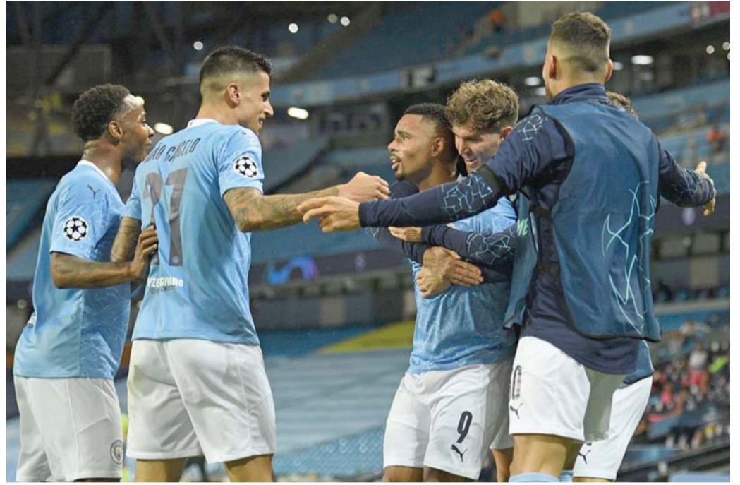
تمسك بعقيدة الانتصار

لايبيغ يدون اسمه بين الكبار ببلوغ نصف النهائي