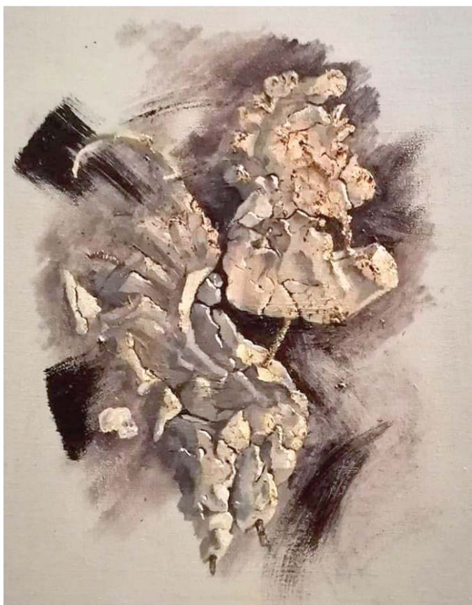
لوحات رانها التاويل

الشيء، وهذا يعني بقاء الحال على ما هو عليه حتى يصيبه التجمد والتجدر لقدمه.