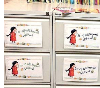
كل طفل يصله كتابه المناسب

الرياض - يحظى مشروع " نادي كتاب الطفل" في مكتبة الملك عبد العزيز العامة بإقبال متزايد من جانب الأطفال، حيث بلغ عدد المشتركين فيه أكثر من 15 ألف طفل على مستوى مناطق المملكة، تصلهم الكتب والقصص فيطالعون ويقروا ويتعرفون على كل جديد من القصص والأفكار والأدب والعلوم في هذا العصر المعلوماتي الكبير.