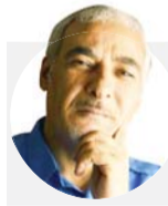
محسن الرملي حكاه فريد من نوعه، إذ هو أقرب إلى عازف الربابة

والشرف المستمر للعراق والعراقيين. واللائق أن الكاتب يمتلك قدرة بارعة على إنبات الضحك من معين الألم، وتحويل وجه القارئ ما بين التبسّم والتأثر في لحظات، وكأنه ينقل للقارئ ذات الحالة النفسية التي اعتملت في دواخله إبان الكتابة: الحوار بدوره كان بارعا في عدة مشاهد، خصوصا في المشاهد الثنائية التي كان كافكا أحد طرفيها، كالحوارة بين كافكا وسميحة، وكافكا والشاعر براء الشخباطي، وكافكا وأبيه، إضافة إلى قصائد براء الشخباطي.